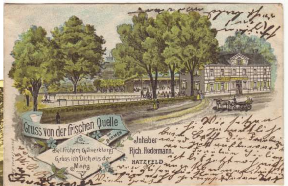
Postkarte mit Poststempel vom 18.08.1897