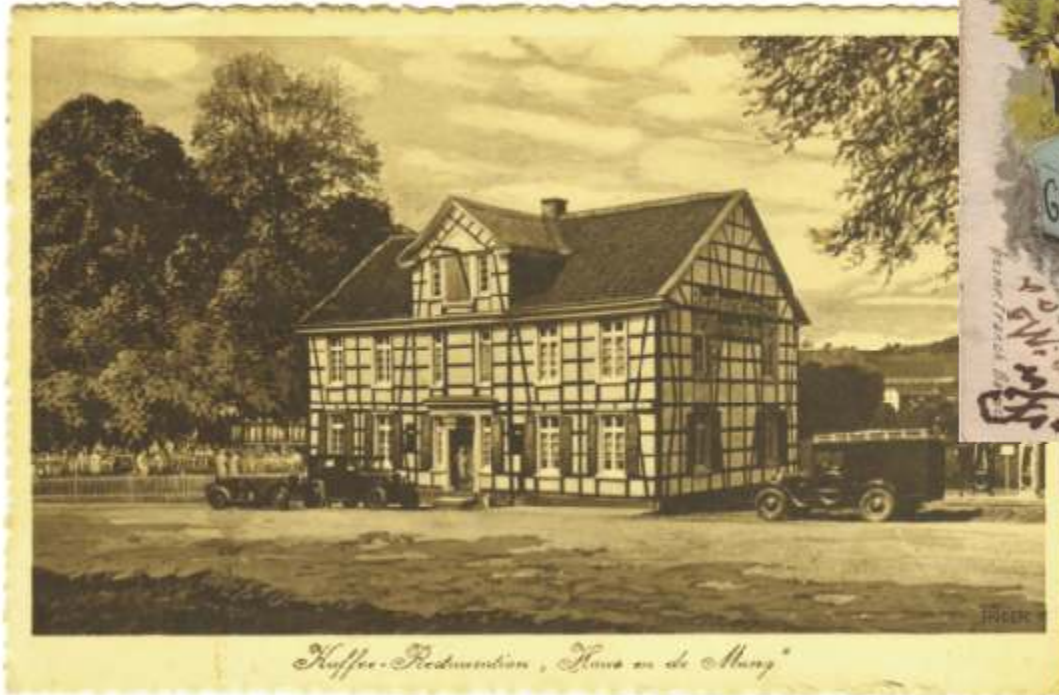
Postkarte mit Poststempel vom 28.01.1935